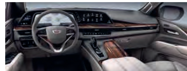
Whisper Beige mit Gideon-Akzenten – HOD Mit allen Außenfarben erhältlich.