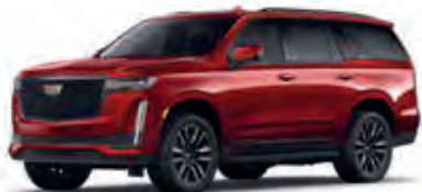
Radiant Red Tintcoat – GNT