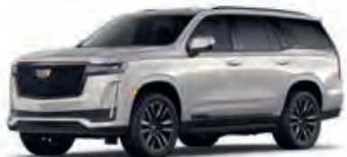
Sandstone Metallic – GJW