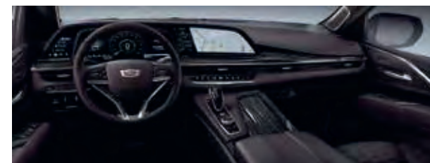
Dark Autumn mit Jet Black-Akzenten – HOE Mit allen Außenfarben erhältlich.