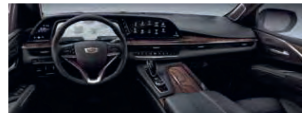
Jet Black – HIZ Mit allen Außenfarben erhältlich.