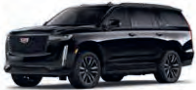
Black Raven – GBA