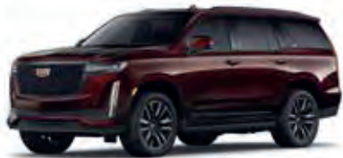
Mahogany Metallic – G48