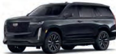
Galactic Grey Metallic – G6M