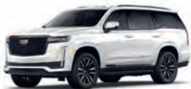
Crystal White Tricoat – G1W