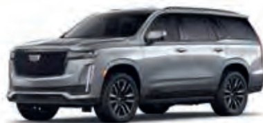
Argent Silver Metallic – GXD