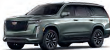
Dark Emerald Metallic – G6N