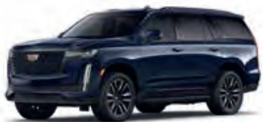
Dark Moon Blue Metallic – GLU